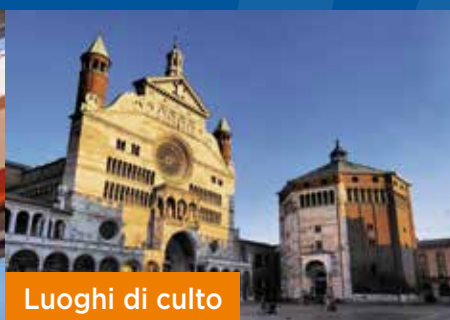
Luoghi di culto